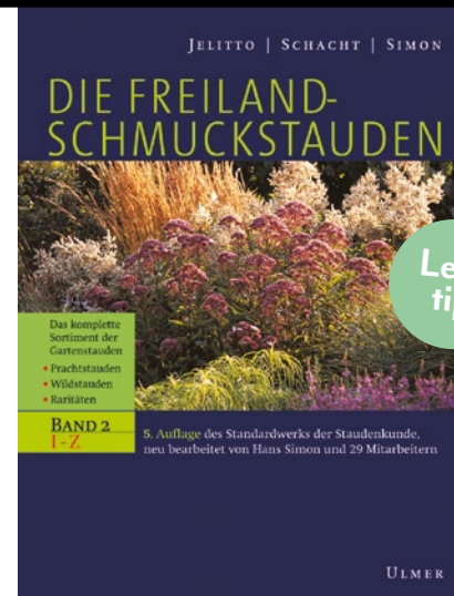
Die Freiland - Schmuckstauden ISBN 9783800132652