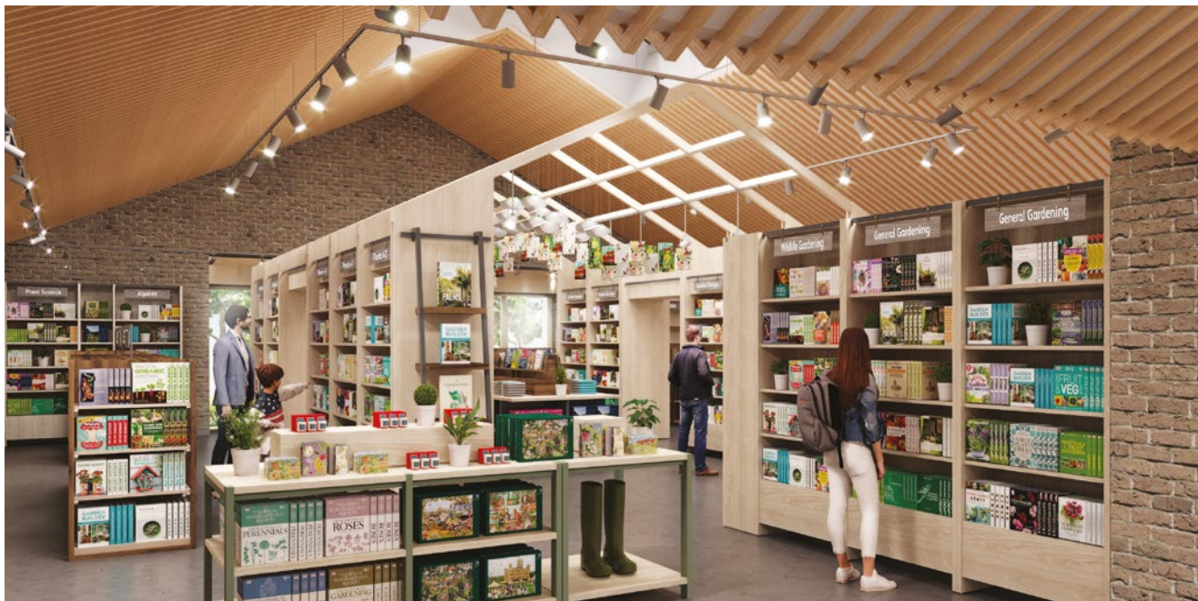
De boekwinkel bij RHS Garden Wisley.