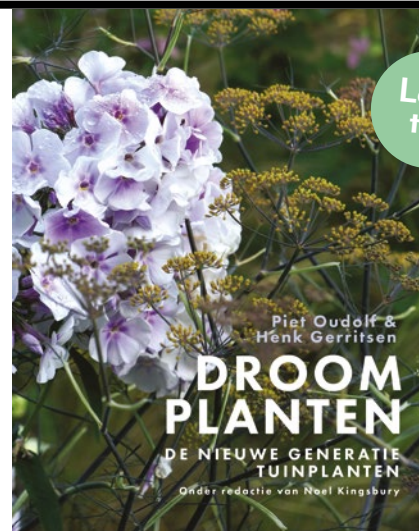
Droomplanten, de nieuwe generatie tuinplanten, Piet Oudolf en Henk Gerritsen, ISBN 9789082683646